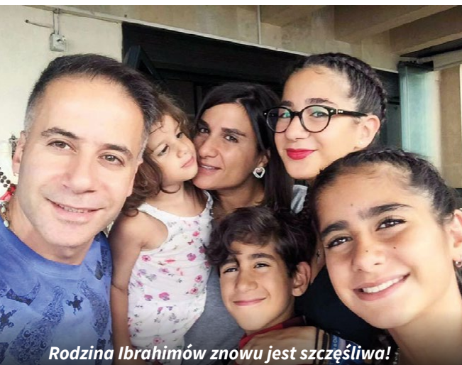
Rodzina Ibrahimów znowu jest szczęśliwa!

Aby i one znalazły drogę od rozpaczki do nadziei, zamierzamy wesprzeć poradnię dla rodzin w Zuk Musbih kwotą 72 000 euro. Kto pomoże libańskim rodzinom na nowo odnaleźć szczęście?