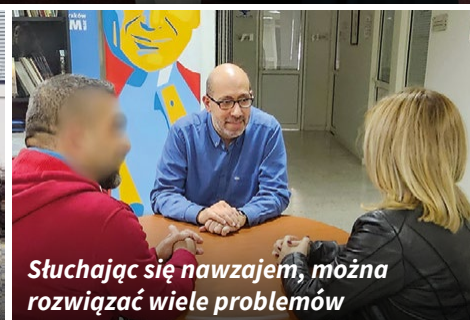
Słuchając się nawzajem, można rozwiązać wiele problemów

dziecko, które powtarzało: „Tak bardzo cię kocham, mammo”.