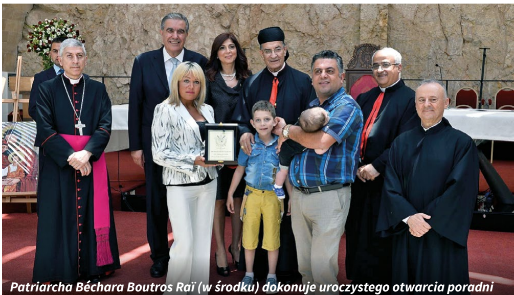
Patriarcha Béchara Boutros Raï (w środku) dokonuje uroczystego otwarcia poradni

Pomóc udało się również siedmioletniemu chłopcu, którego rodzice żyją w separacji i dramatycznie się pokłócili. Ojciec, u którego chłopak mieszkał, tak źle nastawiał go do matki, że na jej widok dziecko wybuchowało krzykiem i płaczem. W trakcie rozmów z obojgiem rodziców pracownice poradni przekonały ojca, że zadaje synowi ciężkie rany psychiczne, które nie zagoją się nawet w dorosłym życiu. Mężczyzna zrozumiał, że nie ma racji, i zaczął zachęcać chłopca, by utrzymywał kontakt z matką i okazywał jej miłość. Matka rozplakała się z radości, kiedy mogła przytulić do serca