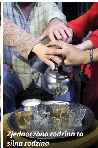
Zjednoczona rodzina to silna rodzina