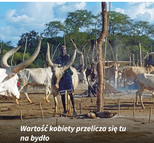
Wartość kobiety przelicza się tu na bydło

Poza tym ważną rolę odgrywają czynniki kulturowe. Największą grupę w Sudanie Południowym tworzą Dinkowie, lud pasterski prowadzący w większości życie koczownicze, który hołduje poligamii. Wartość kobiety przelicza się u nich na bydło. Jeżeli rodzina nie jest w stanie zapłacić za