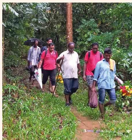
Po długiej drodze przez dżunglę wioskę odwiedza biskup

Wielkim pragnieniem Teresy z Lisieux, świętej karmelitanki i doktora Kościoła, było głoszenie Ewangelii Chrystusa „aż po najdalsze wyspy”. Na pewno spodobatyby się jej archipelagi Andamanów i Nikobarów , które należą do Indii, ale geograficznie są położone bliżej Mjanmy.