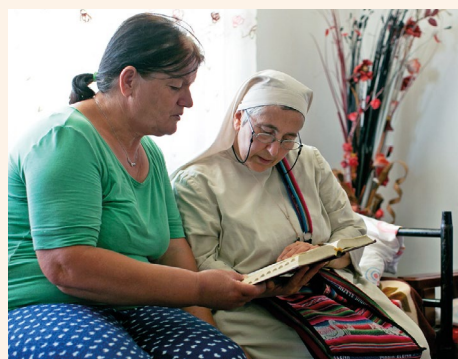
Ta pani chce poznać Biblię, a pomagają jej w tym jedna z sióstr

życia, służąc z miłością wszystkim, którzy potrzebują pomocy. Poprzez swoją miłość i świadectwo życia dyskretnie zmieniają postawy ludzi. Dzięki nim coraz więcej rodzin odnajduje wiarę.