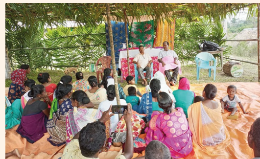
Wierni cieszą się na myśl o nowej kaplicy

Utrudnia to również prace budowlane, dlatego poproszono nas o pomoc w ukończeniu trzech wiejskich kaplic. Jedna z nich jest wznoszona w wiosce Hanspuri w północnych Nikobarach. Aby dotrzeć do tej miejscowości, trzeba odbyć czterogodzinną drogę przez dżunglę w pagórkowatym terenie. Innym sposobem jest trzyipółgodzinna