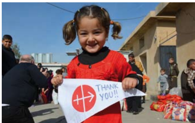
„Bez Was nie mielibyśmy przyszłości” – ta mała dziewczynka wyraża uczucia milionów chrześcijan.

Również w 2015 r. dramat chrześcijan na Bliskim i Środkowym Wschodzie znalazł się w centrum zainteresowania światowych mediów, a także naszej pomocy. Koszty przedsięwzięć w ramach pomocy doraźnej oraz projektów strukturalnych wzrosły ponad dwukrotnie i wynoszą obecnie więcej niż jedną piątą (21,6 %) naszego budżetu ogółem – większe środki (29,3 %) przeznaczamy jedynie na pomoc Afryce. Kwota wsparcia dla Syrii zwiększyła się trzykrotnie. W liczbach bezwzględnych wysokość pomocy wzrosła dla wszystkich regionów – dla Europy Wschodniej o 1,5 mln euro, dla Afryki o 7,8 mln, a dla Bliskiego i Środkowego Wschodu o 11,5 mln. Podobnie jak w ubiegłym roku, najwięcej próśb o pomoc napłynęło z Afryki – rozpatrzyliśmy 2 093 wnioszków z tego kontynentu – na drugim miejscu znalazły się Europa Wschodnia oraz Azja i Oceania . Do Afryki i Azji trafiło też najwięcej stypendiów mszalnych. Ameryka Łacińska pozostaje co prawda młodym kontynentem żywej wiary, na którym powstaje wiele wspólnot katolickich, ale wraz z nimi plenią się tam niczym chwasty sekty i gangi narkotykowe. W tym regionie szczególnie dużo trzeba inwestować w katechezę.