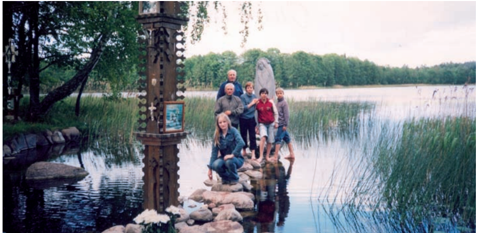
Litwa, kraj krzyży i jezior – mała pielgrzymka młodych.