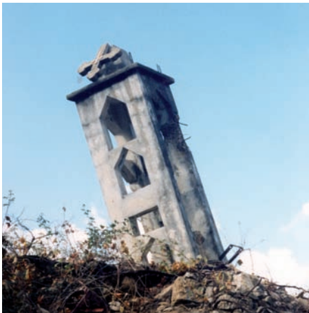
Świadek prześladowań – wieża kościelna pod Saidą na południu Libanu.

Doświadczają tego, gdy któryś z ojców przychodzi, przyznając się ze wstydem, że jego małe córeczki nauczyły go jak powstrzymywać wściekłość i agresję lub kiedy widzą, jak muzułmańskie i chrześcijańskie dzieci wspólnie się bawią. Praca siostr Dobrego Pasterza w parafii Bte-di pod Baalbek w Libanie , z ich 45 dziewczętami w domu i kolejnymi 54 dziećmi w centrum Deir Al Ahmar, wydaje się być kroplą w morzu potrzeb. W tym zniszczonym przez wojnę i przemoc regionie jest to jednak kropla Zbawienia. Z pomocą najskromniejszych środków, siostry umożliwiają swym podopiecznym naukę w szkole, zapewniają im wyżywienie, ubranie, a często także