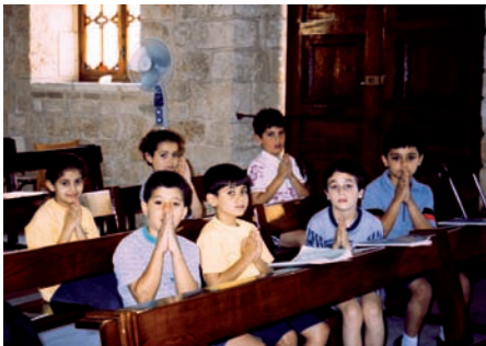
Świadek wiary – nauka modlitwy, także za tych, „którzy was prześladowają”.