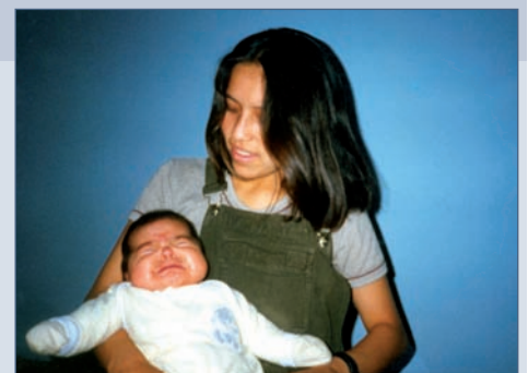
Często udaje się uratować dziecko – młoda mama z Peru.