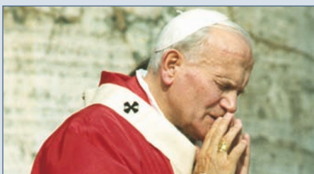
„Różaniec był też zawsze modlitwą rodziny i za rodzinę (...). Stanowi pomoc duchową, której nie należy lekceważyć”.

komunistów wyspie przyczynił się czterechsetny jubileusz znalezienia figury Najświętszej Maryi Panny z El Cobre oraz nasza akcja, związana z dostarcze-