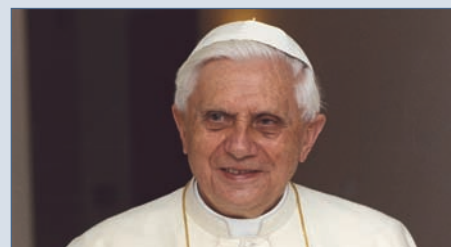
„Chciałbym zachęcić was, drodzy bracia i siostry, do odmawiania Różańca w tym miesiącu w rodzinie, we wspólnotach i parafiach”.

niem na Kubę 250 000 sztuk różańców. To wielki projekt, który wymaga Waszego wsparcia (12 160 000 zł). A także waszej modlitwy.