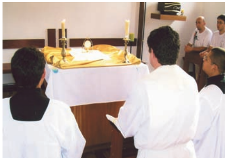
Brazylia, diecezja Caraguatuba – adoracja to źródło siły do każdego działania.

Benedykt XVI podkreśla nieustannie, że kapłani potrzebują solidnej formacji kulturalnej i wiedzy naukowej. Intensywna, ustawiczna edukacja sprzyja rozwojowi dojrzałej osobowości. Aby było to możliwe, potrzebni są dobrzy nauczyciele. Tymczasem profesor uniwersytecki w Ugandzie zarabia 1500 dolarów, a wykładowca w seminarium duchownym – zaledwie 150 dolarów. Pracownicy dydaktyczni w tych placówkach są obciążeni tak bardzo, że nie są w stanie pełnić dodatkowo posługi w parafii czy wykonywać innych prac; formacja przyszłych