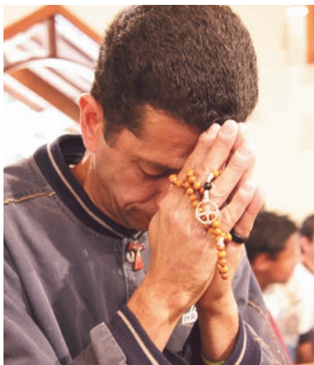
Gwatemala – tajemnica Różańca jest zawsze dla Was.

Owa ufność to istota wiary, coś, co są w stanie pojąć jedynie ludzie modlitwy. Bóg dał Apostołowi Piotrowi obietnicę, że „bramy piekielne nie przemogą Kościoła” (por. Mt 16,18). Podczas gdy wspólnota wierzących w Europie zмага