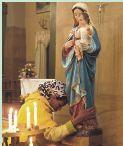
Wspomożenie wiernych, Poczyszczycielka strapionych i Królowa Różańca świętego w Addis Abebie.

Różaniec nie jest praktyką związaną z przeszłością, jako modlitwa dawnych czasów, o której należy myśleć z nostalgią. Tymczasem różaniec przeżywa niejako swą nową wiosnę. Niewątpliwie jest to najwymowniejszy dowód miłości, jaką młode pokolenia darzą Jezusa i Jego Matkę Maryję.