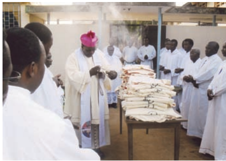
Tanzania – biskup Morogory święci szaty neoprezbiterów.