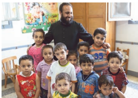
Duszpasterstwo dzieci w Egipcie – „pozwołcie dzieciom przychodzić do Mnie”...

Benedykt XVI podkreśla nieustannie, że kapłani potrzebują solidnej formacji kulturalnej i wiedzy naukowej. Intensywna, ustawiczna edukacja sprzyja rozwojowi dojrzałej osobowości. Aby było to możliwe, potrzebni są dobrzy nauczyciele. Tymczasem profesor uniwersytecki w Ugandzie zarabia 1500 dolarów, a wykładowca w seminarium duchownym – zaledwie 150 dolarów. Pracownicy dydaktyczni w tych placówkach są obciążeni tak bardzo, że nie są w stanie pełnić dodatkowo posługi w parafii czy wykonywać innych prac; formacja przyszłych