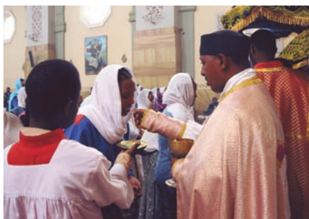
Etiopia – bez kapłanów Ciało Chrystusa byłoby tylko kawałkiem chleba.

Msza Święta jest źródłem życia Kościoła – a także kapłanów.