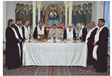
Syria, miasto męczenników Homs – „...które za was będzie wydane”.