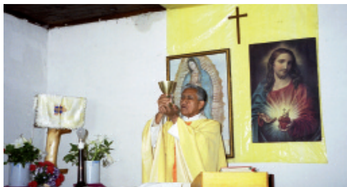
Gwatemala: W ofierze jest zbawienie – także dla księży.

Także w Iraku stypendia mszalne są często jedynym źródłem utrzymania kapłanów. W tym roku, mimo trwającej wojny, arcybiskup udzielił święceń diakonatu czterem klerikom. Tak jest również i w Afryce. „Jesteście jak nasza Matka”, mówi rektor Seminarium w Bomie ( Demokratyczna Republika Konga ), a w Kabale ( Uganda ) rektor swoje przekonanie utożsamia ze sformułowaniem Pawła VI z 1965 roku, że „to jest tajemnica wiary: święta Eucharystia przynosi nam zbawienie i siłę płynącą z przebaczenia.” Tutaj obecny jest Pan – i wszędzie tam, gdzie poprzez stypendia mszalne przyczyniają się Państwo do tego, by również i w Państwa życiu urzeczywistniała się Jego zbawcza moc oraz wszędzie tam, gdzie modlą się w intencjach Państwa w czasie Mszy świętej. ●