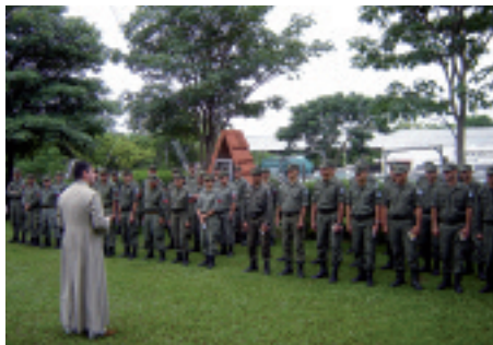
Do modlitwy... wystąp! Pewna kompania w Kordobie (Argentyna) w modlitwie różańcowej.