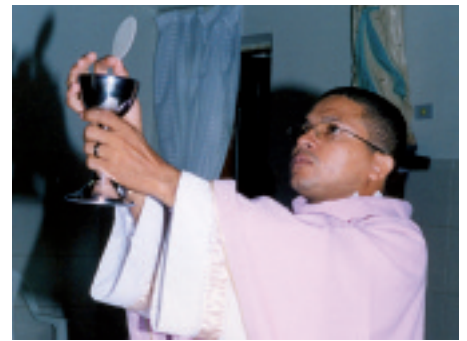
Brazylia: Tutaj obecny jest Pan. W niektórych diecezjach jest On wszystkim, co księża posiadają.

Tu był Pan: w Tyrze i Sydonie, na południu Libanu . Przed Sydonem na wzniesieniu znajduje się figura „Matki Bożej Oczekującej” powrotu syna, zwana Marią z Mantary. W dolinie rozciąga się obóz palestyński, z kilkoma meczetami w tle, a zaraz za nimi znajduje się dzielnica chrześcijan – niczym wyspa, nad którą góruje kilka wież kościelnych. To mógłby być obraz pokojowego współżycia dwóch narodów. Jednak „od 1948 r. Arabowie i Żydzi zwalczają się nawzajem”, pisze maronicki arcybiskup Tyru, „my, chrześcijanie, chcemy być świadkami pojednania i pokoju”. Wojna wyczerpuje ostatnie siły tej diecezji. Jednak chrześcijanie modlą się nadal i kiedy odprawiają Mszę świętą, wiedzą: tutaj obecny jest Pan. „Stypendia mszalne, które Państwo nam przysyłają, są dla nas jak błogosławieństwo niebios”, są nawet czymś więcej: Państwo pomagają nam być świadkami zbawienia i pokoju, pisze arcybiskup.