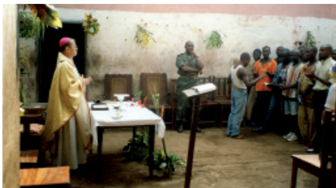
Kamerun: Obecność Pana czyni wszystkich braćmi.

Także w Iraku stypendia mszalne są często jedynym źródłem utrzymania kapłanów. W tym roku, mimo trwającej wojny, arcybiskup udzielił święceń diakonatu czterem klerikom. Tak jest również i w Afryce. „Jesteście jak nasza Matka”, mówi rektor Seminarium w Bomie ( Demokratyczna Republika Konga ), a w Kabale ( Uganda ) rektor swoje przekonanie utożsamia ze sformułowaniem Pawła VI z 1965 roku, że „to jest tajemnica wiary: święta Eucharystia przynosi nam zbawienie i siłę płynącą z przebaczenia.” Tutaj obecny jest Pan – i wszędzie tam, gdzie poprzez stypendia mszalne przyczyniają się Państwo do tego, by również i w Państwa życiu urzeczywistniała się Jego zbawcza moc oraz wszędzie tam, gdzie modlą się w intencjach Państwa w czasie Mszy świętej. ●