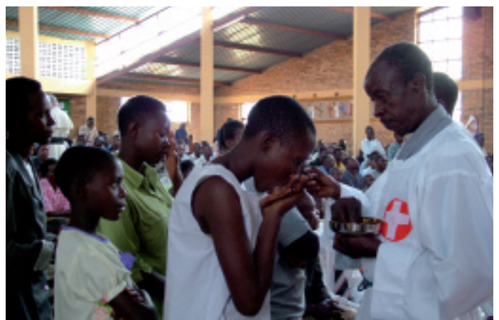
Ruanda: W Eucharystii tkwi siła do przebaczenia.

Tu był Pan: w Tyrze i Sydonie, na południu Libanu . Przed Sydonem na wzniesieniu znajduje się figura „Matki Bożej Oczekującej” powrotu syna, zwana Marią z Mantary. W dolinie rozciąga się obóz palestyński, z kilkoma meczetami w tle, a zaraz za nimi znajduje się dzielnica chrześcijan – niczym wyspa, nad którą góruje kilka wież kościelnych. To mógłby być obraz pokojowego współżycia dwóch narodów. Jednak „od 1948 r. Arabowie i Żydzi zwalczają się nawzajem”, pisze maronicki arcybiskup Tyru, „my, chrześcijanie, chcemy być świadkami pojednania i pokoju”. Wojna wyczerpuje ostatnie siły tej diecezji. Jednak chrześcijanie modlą się nadal i kiedy odprawiają Mszę świętą, wiedzą: tutaj obecny jest Pan. „Stypendia mszalne, które Państwo nam przysyłają, są dla nas jak błogosławieństwo niebios”, są nawet czymś więcej: Państwo pomagają nam być świadkami zbawienia i pokoju, pisze arcybiskup.