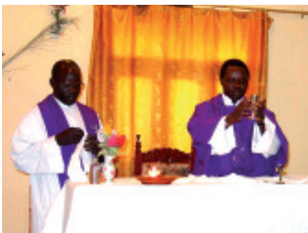
Sudan: Ojcowie Guido i Todo nie mogliby przeżyć bez Państwa pomocy.