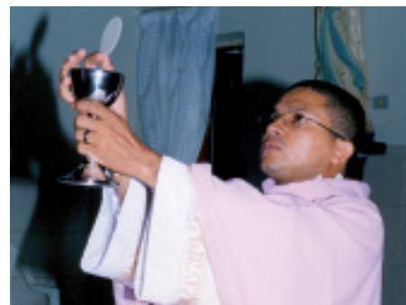
Brazylia: Tutaj obecny jest Pan. W niektórych diecezjach jest On wszystkim, co księża posiadają.

Tu był Pan: w Tyrze i Sydonie, na południu Libanu . Przed Sydonem na wzniesieniu znajduje się figura „Matki Bożej Oczekującej” powrotu syna, zwana Marią z Mantary. W dolinie rozciąga się obóz palestyński, z kilkoma meczetami w tle, a zaraz za nimi znajduje się dzielnica chrześcijan – niczym wyspa, nad którą góruje kilka wież kościelnych. To mógłby być obraz pokojowego współżycia dwóch narodów. Jednak „od 1948 r. Arabowie i Żydzi zwalczają się nawzajem”, pisze maronicki arcybiskup Tyru, „my, chrześcijanie, chcemy być świadkami pojednania i pokoju”. Wojna wyczerpuje ostatnie siły tej diecezji. Jednak chrześcijanie modlą się nadal i kiedy odprawiają Mszę świętą, wiedzą: tutaj obecny jest Pan. „Stypendia mszalne, które Państwo nam przysyłają, są dla nas jak błogosławieństwo niebios”, są nawet czymś więcej: Państwo pomagają nam być świadkami zbawienia i pokoju, pisze arcybiskup.