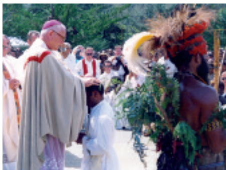
Papua-Nowa Gwinea: Wybierając kapłaństwo tutaj, decydują się na życie w biedzie.