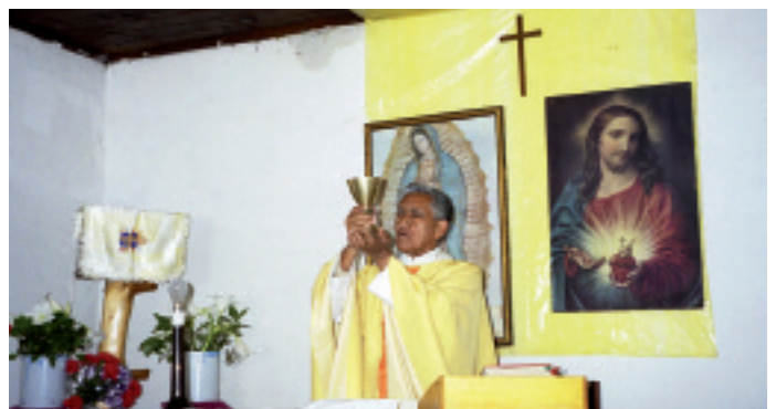
Gwatemala: W ofierze jest zbawienie – także dla księży.

Także w Iraku stypendia mszalne są często jedynym źródłem utrzymania kapłanów. W tym roku, mimo trwającej wojny, arcybiskup udzielił święceń diakonatu czterem klerikom. Tak jest również i w Afryce. „Jesteście jak nasza Matka”, mówi rektor Seminarium w Bomie ( Demokratyczna Republika Konga ), a w Kabale ( Uganda ) rektor swoje przekonanie utożsamia ze sformułowaniem Pawła VI z 1965 roku, że „to jest tajemnica wiary: święta Eucharystia przynosi nam zbawienie i siłę płynącą z przebaczenia.” Tutaj obecny jest Pan – i wszędzie tam, gdzie poprzez stypendia mszalne przyczyniają się Państwo do tego, by również i w Państwa życiu urzeczywistniała się Jego zbawcza moc oraz wszędzie tam, gdzie modlą się w intencjach Państwa w czasie Mszy świętej. ●