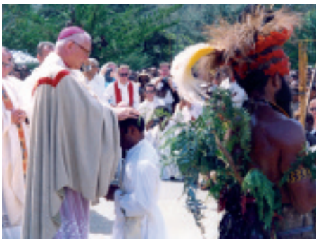
Papua-Nowa Gwinea: Wybierając kapłaństwo tutaj, decydują się na życie w biedzie.