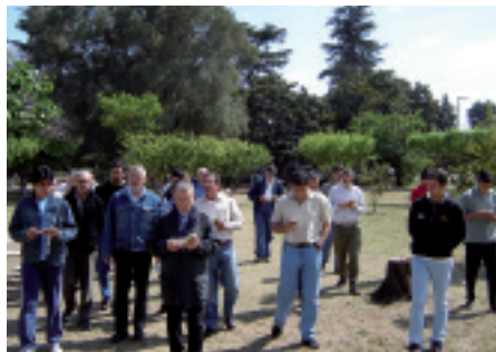
Wewnętrzna wolność: Dni skupienia z Maryją dla więźniów w Kordobie.