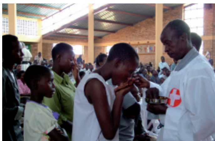
Ruanda: W Eucharystii tkwi siła do przebaczenia.

Tu był Pan: w Tyrze i Sydonie, na południu Libanu . Przed Sydonem na wzniesieniu znajduje się figura „Matki Bożej Oczekującej” powrotu syna, zwana Marią z Mantary. W dolinie rozciąga się obóz palestyński, z kilkoma meczetami w tle, a zaraz za nimi znajduje się dzielnica chrześcijan – niczym wyspa, nad którą góruje kilka wież kościelnych. To mógłby być obraz pokojowego współżycia dwóch narodów. Jednak „od 1948 r. Arabowie i Żydzi zwalczają się nawzajem”, pisze maronicki arcybiskup Tyru, „my, chrześcijanie, chcemy być świadkami pojednania i pokoju”. Wojna wyczerpuje ostatnie siły tej diecezji. Jednak chrześcijanie modlą się nadal i kiedy odprawiają Mszę świętą, wiedzą: tutaj obecny jest Pan. „Stypendia mszalne, które Państwo nam przysyłają, są dla nas jak błogosławieństwo niebios”, są nawet czymś więcej: Państwo pomagają nam być świadkami zbawienia i pokoju, pisze arcybiskup.