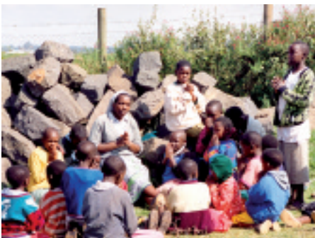
Jan Paweł II: „Rodzina, która modli się wspólnie, trwa zjednoczona”. Czy to wśród natury czy w kaplicy, w Kenii lub Armenii: wszędzie łączy nas Maryja.