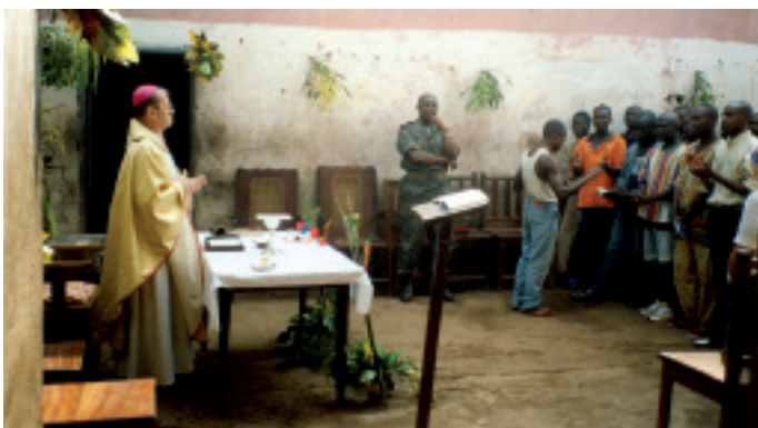
Kamerun: Obecność Pana czyni wszystkich braćmi.

Także w Iraku stypendia mszalne są często jedynym źródłem utrzymania kapłanów. W tym roku, mimo trwającej wojny, arcybiskup udzielił święceń diakonatu czterem klerikom. Tak jest również i w Afryce. „Jesteście jak nasza Matka”, mówi rektor Seminarium w Bomie ( Demokratyczna Republika Konga ), a w Kabale ( Uganda ) rektor swoje przekonanie utożsamia ze sformułowaniem Pawła VI z 1965 roku, że „to jest tajemnica wiary: święta Eucharystia przynosi nam zbawienie i siłę płynącą z przebaczenia.” Tutaj obecny jest Pan – i wszędzie tam, gdzie poprzez stypendia mszalne przyczyniają się Państwo do tego, by również i w Państwa życiu urzeczywistniała się Jego zbawcza moc oraz wszędzie tam, gdzie modlą się w intencjach Państwa w czasie Mszy świętej. ●