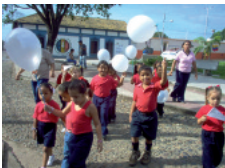
Wenezuela, 18 października 2006 r.: dzieci promieniują radością po modlitwie różańcowej.

kształt”, a „różaniec składa się ze świętych słów”. Pomódlmy się z nimi. ●