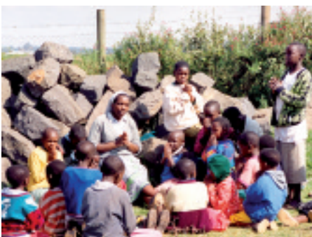
Jan Paweł II: „Rodzina, która modli się wspólnie, trwa zjednoczona”. Czy to wśród natury czy w kaplicy, w Kenii lub Armenii: wszędzie łączy nas Maryja.