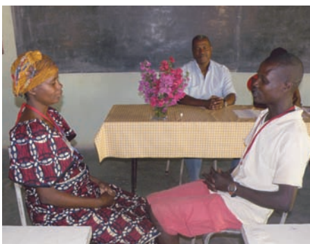
W Afryce Środkowej konieczne jest wyjaśnienie i uporządkowanie sfery seksualnej.

wadzenie biura, materiały szkoleniowe). Chcemy go wesprzeć kwotą 52 000 zł.