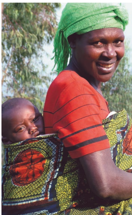
W Ruandzie do Matki Bożej udają się wszyscy – pielgrzymka do Kibeho.

W Timorze Wschodnim zaniepokojeni są nawet księża. Tutaj dzieci mają dzieci, a młodzi małżonkowie wiedzą zbyt mało o psychice mężczyzny i kobiety, ludzkim ciele, fazach kobiecego cyklu i objawach płodności. Tego wszystkiego uczą się oni na kursach o naturze człowieka i godności osoby ludzkiej jako stworzonej na obraz Boga. Jan Paweł II stworzył na tej podstawie nawet teologię ciała. Życie i przeżywanie miłości w atmosferze wzajemnego szacunku daje ludziom poczucie wartości. Szczególnie dotyczy to kobiet. W trzech diecezjach młodego państwa, którego ludność w ponad 95% stanowią katolicy, kursy cieszą się dużym zainteresowaniem. Szkoli się nauczycieli, adaptuje programy, tworzy grupy. Ubogi Kościół nie jest jednak w stanie sam ponosić wszystkich kosztów (ksero, pro-