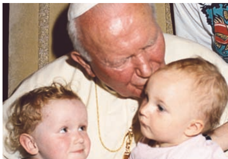
Nikt nie pisał o rodzinie tyle co bł. Jan Paweł II.