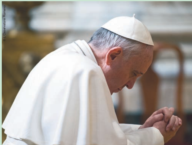
„Pod Twoją obronę” – swe pierwsze kroki papież Franciszek skierował do Matki Bożej

Wszchemocnemu wstawiennictwu Maryi, Matki Kościoła zawierzam moją i waszą postugę. Niech pod Jej macierzyńskim spojrzeniem, każdy z was wędruje z radością, posłuszny głosowi Jej Boskiego Syna, umacniając jedność, zgodnie trwając na modlitwie i dając świadectwo autentycznej wiary w nieustanną obecność Pana.