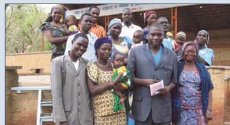
Małżeństwa po warsztatach zaczynają rozmawiać ze sobą i razem się modlić.

rozumieniu małżeństwa i rodziny. Zapotrzebowanie jest ogromne. Brakuje domu rekolekcyjnego. Udało się zdobyć kawałek ziemi, ale na budowę już nie wystarczyło. Obiecaliśmy 98 000 zł – żeby miłość nie traciła swej dynamiki. ●