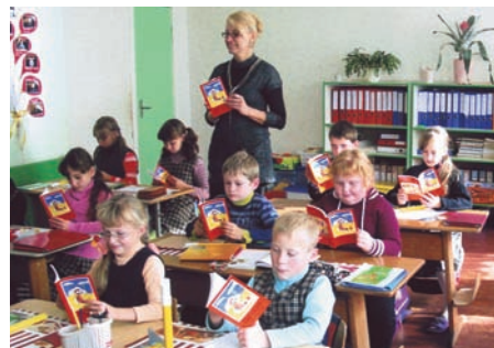
Litwa – „Bóg mówi do swoich dzieci” na lekcji religii.

w jego kraju nie istnieje prawie w ogóle literatura religijna, brakuje dobrych książek do nauki wiary i wychowywania w niej. Nawrócenie, katechizacja, wychowanie – na trzy lata przed śmiercią św. Jan Bosko, człowiek, który znał się na tym doskonale, wołał: „Jakże wiele dusz zostało uratowanych dzięki dobremu książkom!”. Wy także możecie się dziś do tego przyczynić. ●