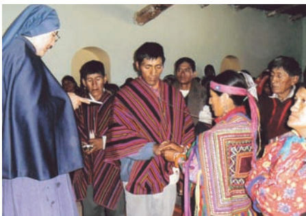
Peru – odnowienie przysięgi małżeńskiej, tym razem z większą świadomością.

W mediach encyklika Pawła VI „ Humanae vitae ” bywa przedstawiana jako „encyklika przeciwko antykoncepcji”. Tymczasem jest ona czymś znacznie więcej niż głosem sprzeciwu wobec sztucznej regulacji poczęć. W dokumencie tym zapisano profetyczne słowa o małżeństwie jako „najgłębszej i najpełniejszej formie przyjaźni”.