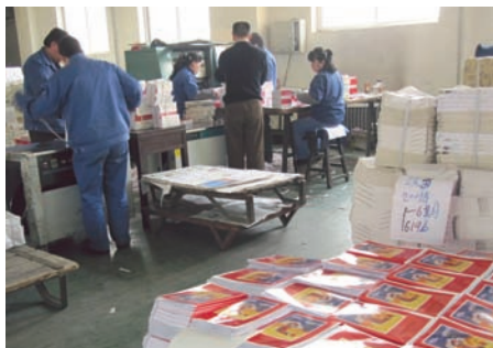
Chiny – dostawa Biblii dla dzieci, bo głód wiary jest wielki.

nią się one do nawrócenia kolejnych braci”.