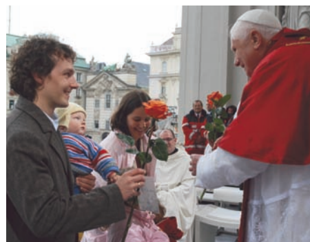
Benedykt XVI: „Rodzina jest kolebką wartości ogólnoludzkich i chrześcijańskich”.

Na Ukrainie mamy do czynienia z innym problemem: tam młode małżeństwa muszą się nauczyć, że aborcja nie jest metodą regulowania poczęć, lecz formą zabijania dzieci. Po dziesięcioleciach niszczenia człowieka wraz z jego zdolnością do kochania świadomość tego faktu musi być dopiero obudzona. Trzeba pomóc ludziom odkryć godność życia i osoby, a także ogromne znaczenie rodziny zarówno dla jednostki, jak i dla społeczeństwa. Wszystkie te zadania wymagają stworzenia struktury poradnictwa rodzinnego. Brakuje jednak kompetentnych nauczycieli regulacji poczęć i natury człowieka. W każdej diecezji szkoleni są pod tym kątem świeccy, siostry zakonne i księża. Wspieramy te szkolenia kwotą 24 000 zł, ponieważ na Ukrainie, jak i wszędzie indziej, niezwykle aktualne wydają się słowa bł. Jana Pawła II: „Rodzina jest drogą Kościoła”. Jego następca, Benedykt XVI, dodał, że jest ona „powołaniem do miłości, która czyni człowieka prawdziwym obrazem Boga”.