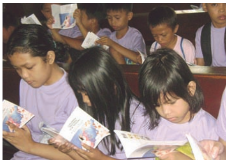
Filipiny – w diecezji Manila dzieci modlą się na różańcu.