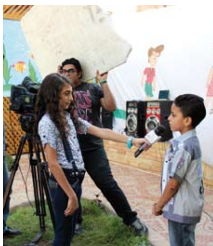
Tutaj jesteśmy w domu – wywiad w Sat7, chrześcijańskiej telewizji dla Bliskiego Wschodu.

Odnawianie oblicza ziemi – taki jest właśnie cel głoszenia Dobrej Nowiny za pomocą słów i obrazów. Duch musi się posługiwać również środkami nowoczesnej techniki. Na Ukrainie działa On poprzez EWTN („Sieć Telewizyjną Wiecznego Słowa”). Wsparliśmy wprowadzenie tej największej na świecie katolickiej stacji telewizyjnej do sieci kablowych. Niebawem rozpocznie on